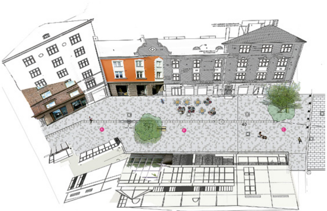
Konstnärens visualisering visar potentiella placeringar för konstverket i pilotprojektet för integrerad konst på Otavalankatu i Tammerfors. KONSTVERKSUTKAST OCH FOTO Maija Kovari

Lagen styr de olika skedena av planeringen av en offentlig miljö på olika sätt. Målet är att skapa en fungerande miljö som också kommunens invånare kan påverka. Även om systemet är reglerat i detalj, erbjuder de multisektoriella förfarandena inom det många möjligheter för samarbete mellan proffs inom konst och planering.