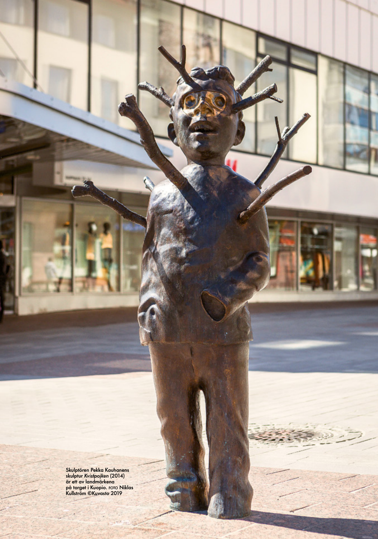
Skulptören Pekka Kauhanens skulptur Kvistpojken (2014) är ett av landmärkena på torget i Kuopio. Foto Niklas Kullström ©Kuvasto 2019