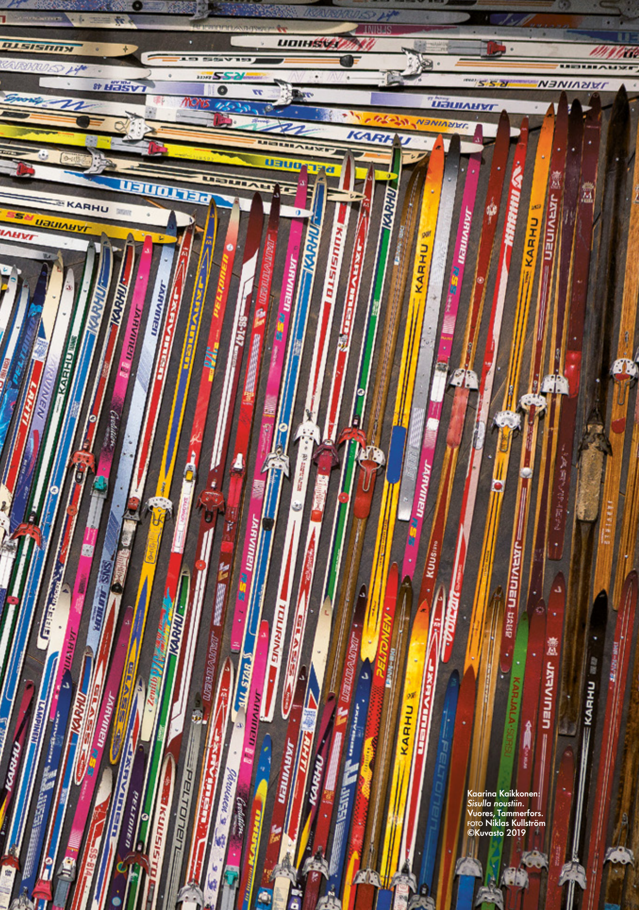
Kaarina Kaikkonen: Sisulla nousiin. Vuores, Tammerfors.